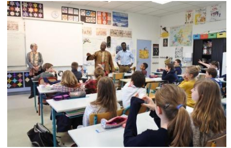
Echange entre un partenaire nigérien et une classe de Louvigny

Par ailleurs, les animateurs de Mézidon et d'ifs ont démarré l'interconnaissance entre enfants autour d'activités communes lors du 1 er semestre 2017