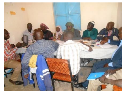
Séance de formation à la radio Gyaré

Une première rencontre a été effectuée avec la commune de Sabon Machi et les principaux acteurs impliqués dans la gestion du marché le 3 mars 2017. Il s'avère qu'il existe déjà un projet financé par l'USAID (Etats-Unis), REGIS-ER (résilience et croissance économique au Sahel) qui a pour objectif de réorganiser le marché de Sabon Machi.