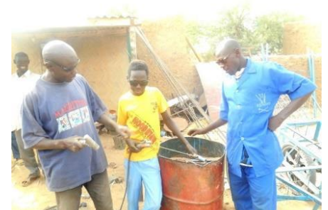
Formation en construction métallique